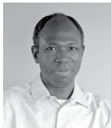
Casimir KAM Informatique