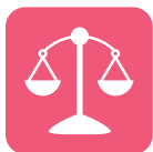
Département Carrières Juridiques