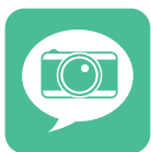
Département Information Communication