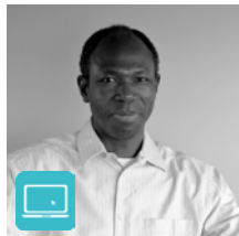
Casimir KAM Informatique