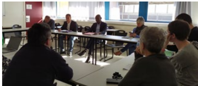
Rencontre avec les personnels le mercredi 15 mars