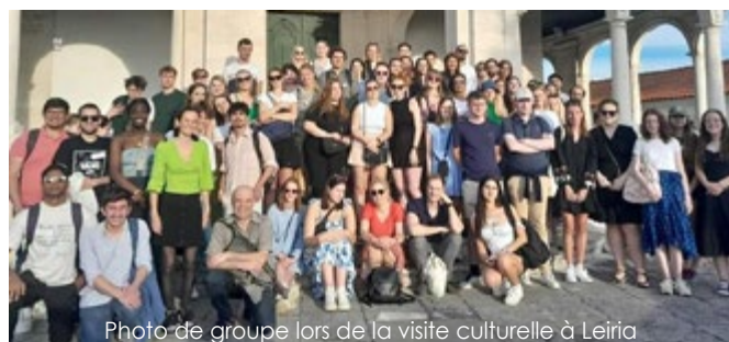
Photo de groupe lors de la visite culturelle à Leiria

Au programme, faire du « Droit » comparé entre les pays en travaillant sur des problématiques juridiques communes. Les 3 établissements partenaires étaient ici l'Instituto Politécnico de Leiria (Portugal), l'Université de Sciences Appliquées Vives (Belgique) et l'IUT de Rodez (France).