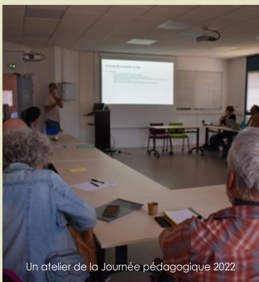
Un atelier de la Journée pédagogique 2022