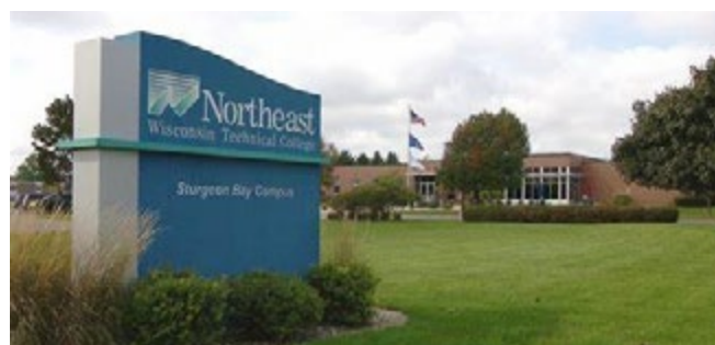
Northeast Wisconsin Technical College

Chaque équipe, composée de 2 ou 3 étudiants français et de 2 ou 3 étudiants américains, a présenté son analyse comparative lors d'une soutenance le 14 avril 2023.