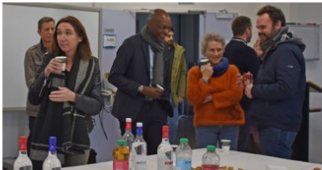
Hugues Kenfack partage un moment convivial avec le personnel

Jedi 26 janvier , le Président de l'Université Toulouse Capitole, Hugues Kenfack , est venu adresser ses vœux aux personnels de l'IUT de Rodez. Les échanges dans l'amphithéâtre de l'IUT se sont poursuivis par un moment convivial !